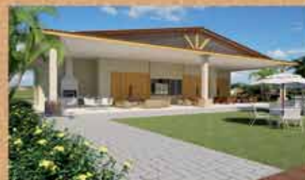
Fachada da Varanda