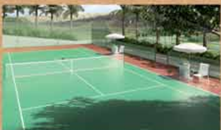
Quadra de Tênis